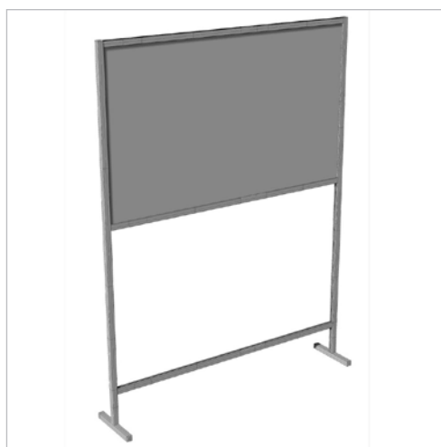
es. Parete divisoria a T da terra